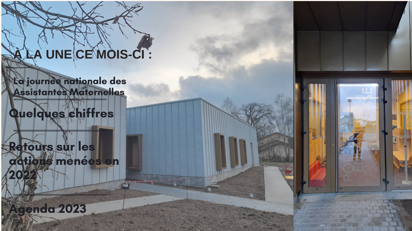
Photo : Nouveaux locaux du Relais Petite Enfance de Bessines sur Gartempe