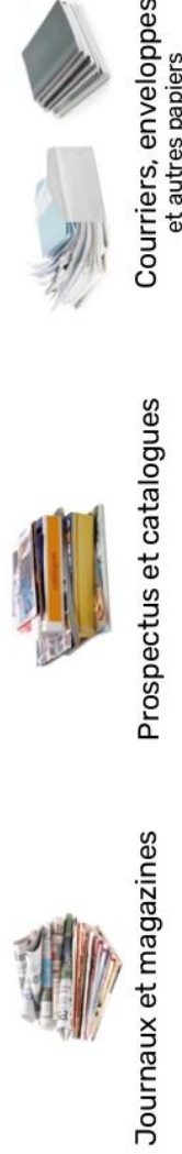
Journaux et magazines