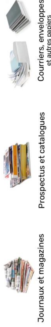
Journaux et magazines