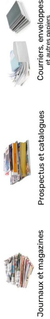
Journaux et magazines