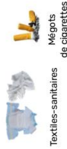
Textiles-sanitaires Mégoths de cigarettes