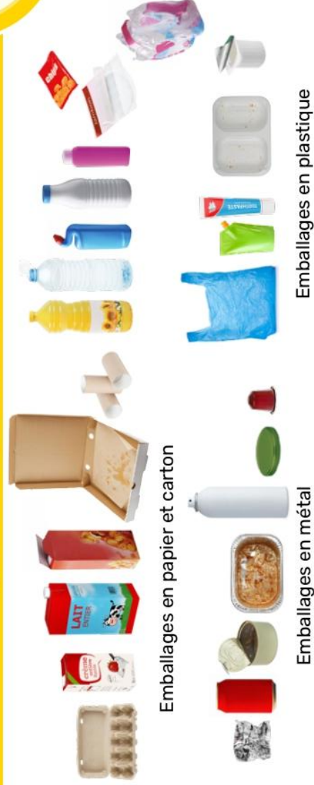
Emballages en papier et carton

TOUS LES EMBALLAGES EN PLASTIQUE, MÉTAL ET CARTON